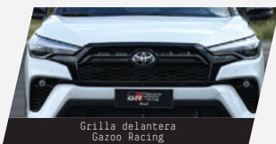
Grilla delantera Gazoo Racing