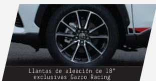
Llantas de aleación de 18" exclusivas Gazoo Racing